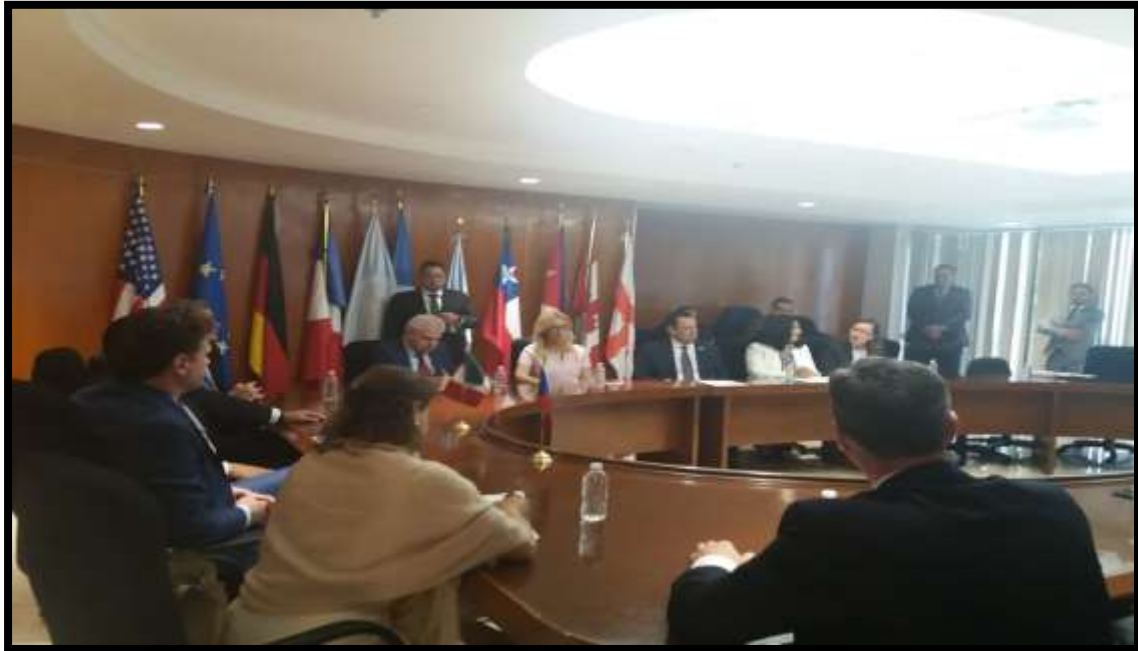
Encuentro en la sala “Gilberto Bosques Saldívar” de la Comisión de Relaciones Exteriores.

“2021, Año de la Independencia y la Grandeza de México” “LXIV Legislatura de la Paridad de Género”