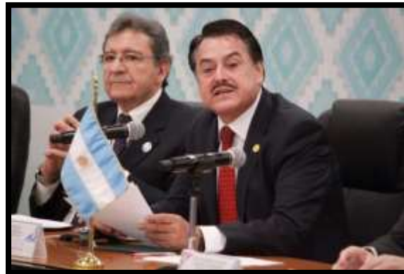
Participación del Diputado Alfredo Femat, Presidente de la Comisión de Relaciones Exteriores.