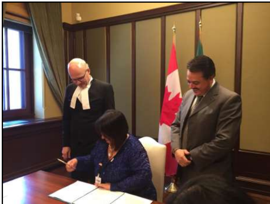
Firma de la Declaración conjunta de la XXII Reunión Interparlamentaria entre México y Canadá