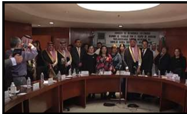
Foto oficial de la Reunión de Trabajo del Grupo de Amistad