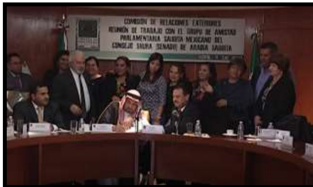
Participación de legisladores saudíes y mexicanos.