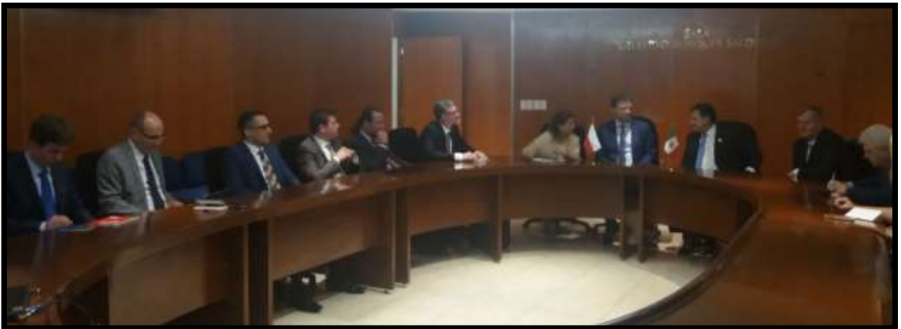
Reunión en la Comisión de Relaciones Exteriores de la H. Cámara de Diputados.