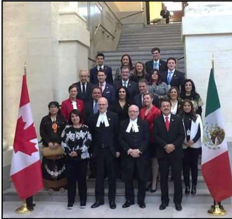
Foto oficial de la XXII Reunión Interparlamentaria Canadá-México (Legisladores mexicanos y canadienses)

“2021, Año de la Independencia y la Grandeza de México” “LXIV Legislatura de la Paridad de Género”