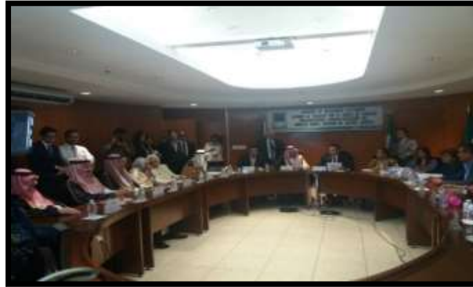
Reunión en la Sala “Gilberto Bosques Saldívar” de la Comisión de Relaciones Exteriores

“2021, Año de la Independencia y la Grandeza de México” “LXIV Legislatura de la Paridad de Género”