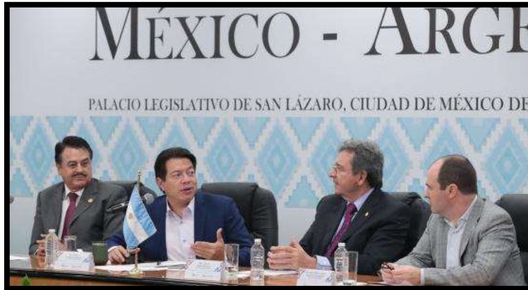
Participación de Legisladores argentinos y mexicanos.

“2021, Año de la Independencia y la Grandeza de México” “LXIV Legislatura de la Paridad de Género”