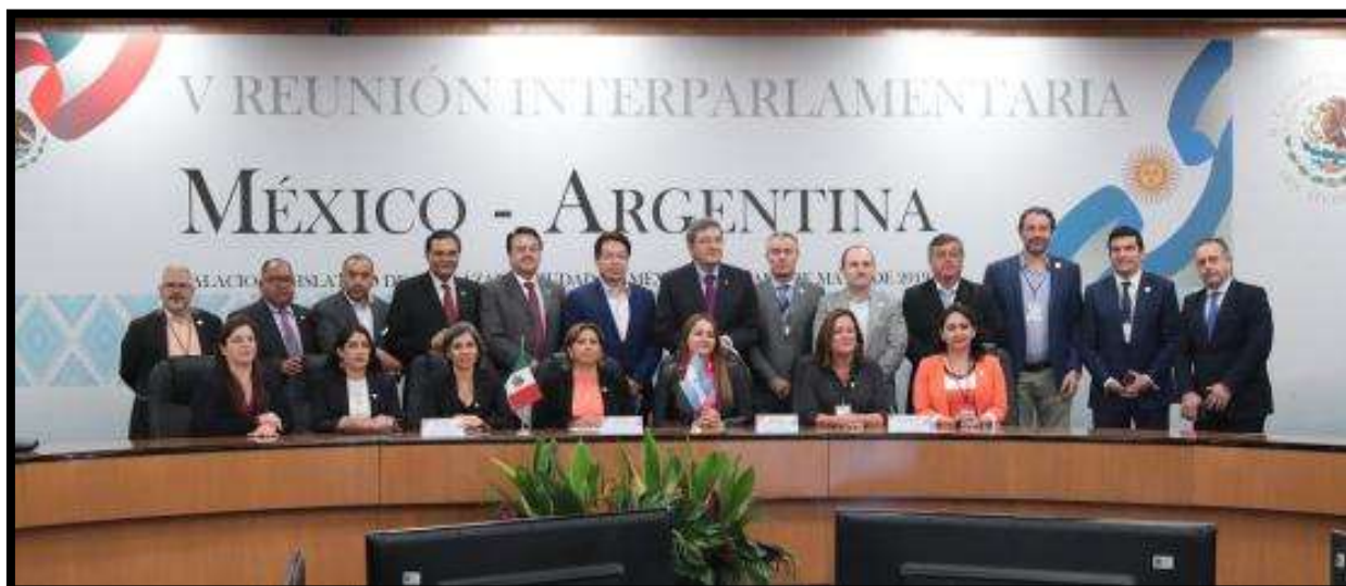
Foto oficial de la V Reunión Interparlamentaria México – Argentina.